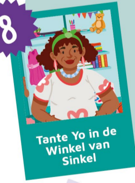
Tante Yo in de Winkel van Sinkel

"Ik heb altijd met veel plezier gewerkt. Nu ik met pensioen ben, doe ik met net zoveel plezier vrijwilligerswerk. Onder andere voor Bliëp. Het doel van Bliëp gaat mij aan het hart, want elk kind moet toch de kans krijgen om zo fijn mogelijk op te groeien. Als ik daar iets voor kan doen, doe ik dat. Daarom ben ik als tante in de Winkel van Sinkel te vinden. Daar bied ik een luisterend oor en help ik de kinderen die langskomen verder op weg. Wat er ook nodig is, ik zorg dat het geregeld wordt. En als het even rustig is in de winkel, maak ik mij op een andere manier nuttig. Met hand-en-spandiensten, zoals het inpakken van de Bliëp-lespakketten. Want stilzitten, dat kan ik niet!"