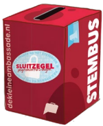
Stembus (rode doos waarin de kranten worden geleverd)

Het Doe-het-zelf-stembuspakket bestaat uit: