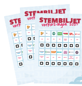
Stembiljetten voor alle leerlingen