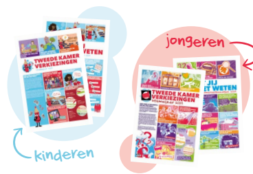
Stemwijzerkranten, inclusief Wat-jij-moet-weten-bijlage, voor alle leerlingen