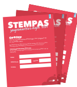
Stempassen voor alle leerlingen