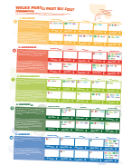
Stemwijzer-involvement voor alle leerlingen