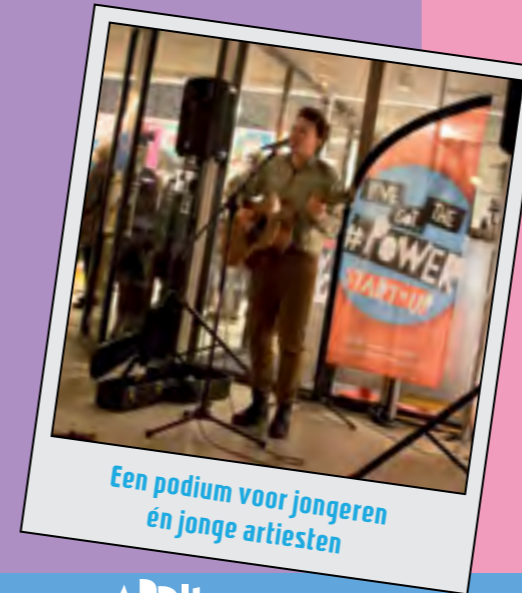
Een podium voor jongeren én jonge artiesten

Werving Meet up 1 / voorbereiding pitches jongeren