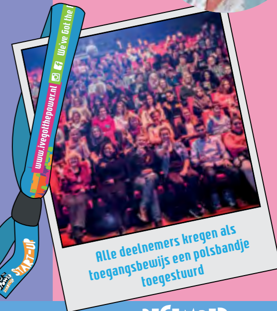
Alle deelnemers kregen als toegangsbewijs een polsbandje toegestuurd