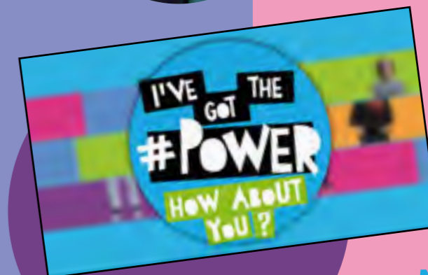
Er werd meer dan 60 uur aan beeld opgenomen voor de documentaire

Restyling van de website / Nominatie voor Appeltjes van Oranje / Brainstorm Jongeren en cultuur / Start organisatie Ie Meet up 2018 / Uitwerking programma 2018