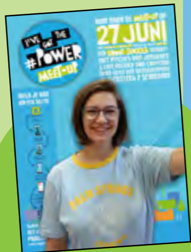
Aanmelden met een selfie voor de selfieposter