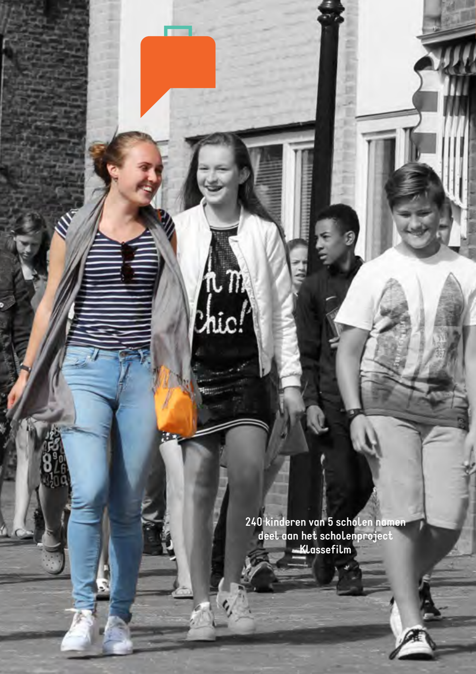
240 kinderen van 5 scholen namen deel aan het scholenproject Klassefilm