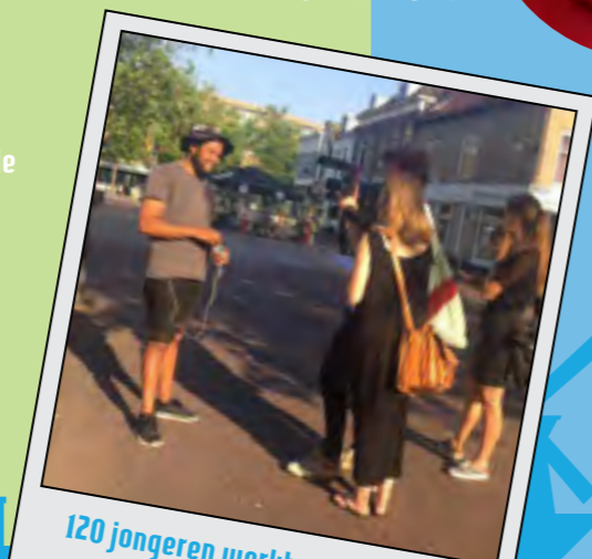
120 jongeren werkten mee aan de documentaire

Montage documentaire / Werving Start up / Afsluiting coachingstraject / Programma Start up compleet