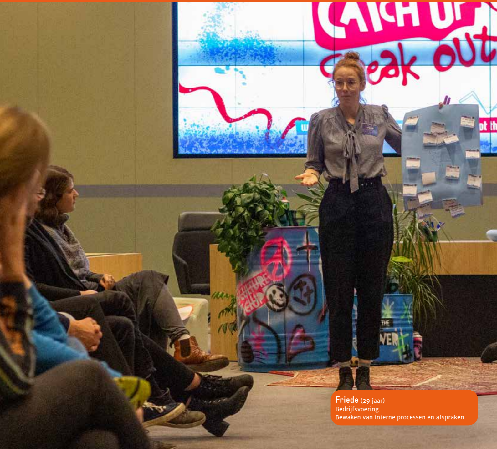
Friede (29 jaar) Bedrijfsvoering Bewaken van interne processen en afspraken

Hoe vergroot je de betrokkenheid van jongeren bij hun leefomgeving en laat je ze ontdekken dat zij binnen die omgeving zelf het verschil kunnen maken? Wij doen dat door jongeren te laten ervaren dat meedenken en meedoen loont. We geven jongeren de kans om aan de slag te gaan met de onderwerpen die zij belangrijk vinden. Daarnaast helpen we ze om hun ideeën en verbeterpunten onder de aandacht te brengen bij gemeenten en organisaties, zodat die er ook mee aan de slag kunnen. Dat laatste is voor ons een belangrijk aandachtspunt in ieder project, want wanneer jongeren en professionals elkaar weten te vinden kunnen ze samen nog meer betekenen voor alle jongeren in de stad.